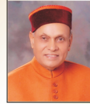
प्रो. प्रेम कुमार धूमल माननीय मुख्यमंत्री